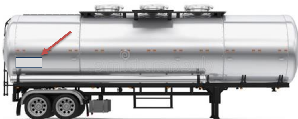
Imagem – IMPLEMENTO.

Abaixo alguns exemplos de implementos e onde devem ser instalado as Tags.