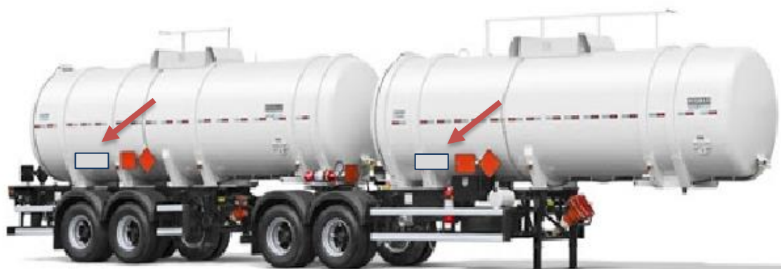
Imagem – TANQUE BITREM.