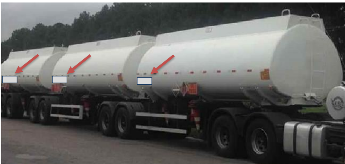
Imagem – TANQUE RODOTREM.